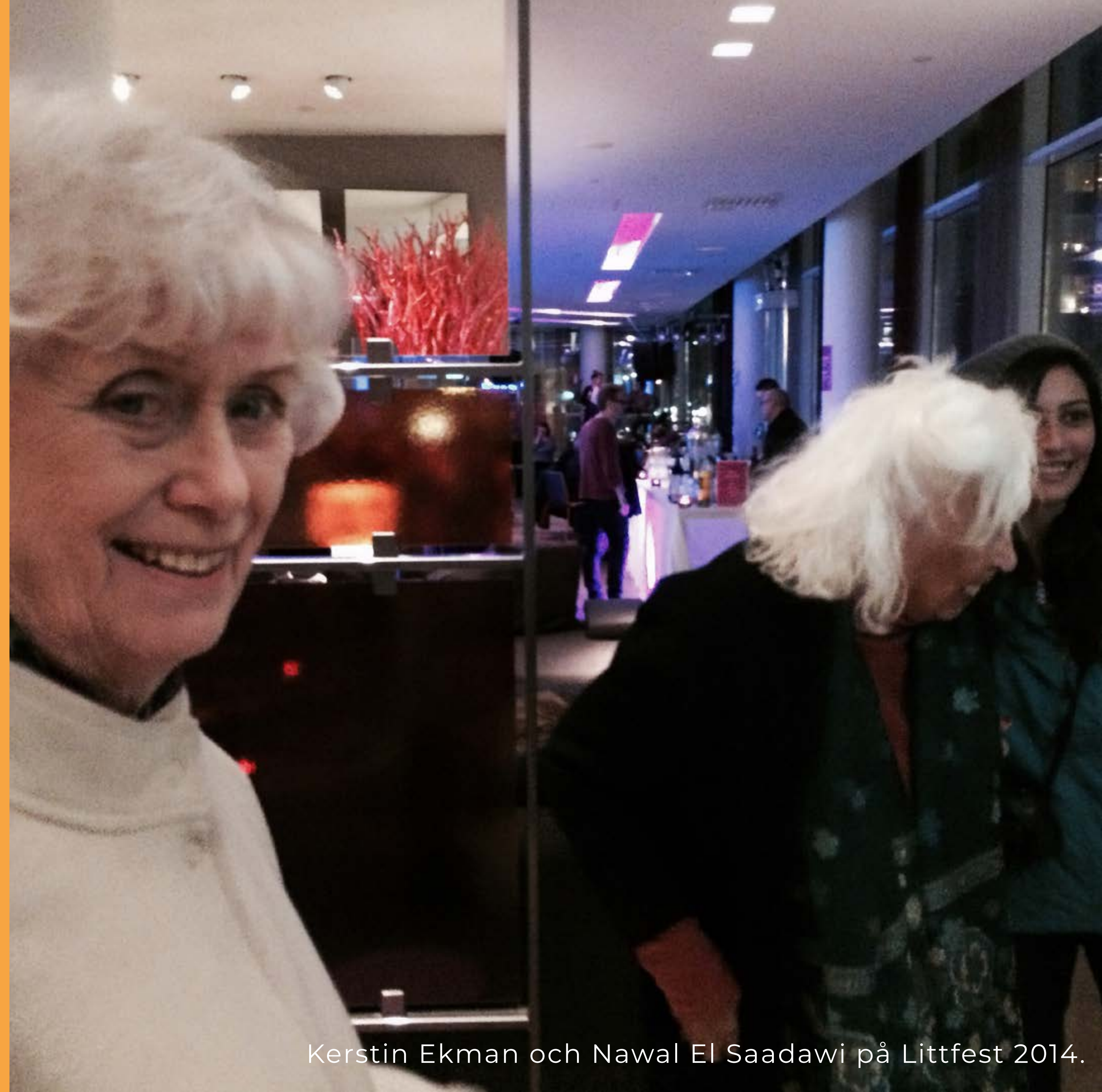
Kerstin Ekman och Nawal El Saadawi på Littfest 2014.

”I samarbete med Littfest 2016 i Umeå arrangerades seminariet ”En mångfald av ord” torsdagen den 17 mars, där tio programpunkter genererade mer än 1 100 unika besök.” Samarbetet med grannlänen innebar nya kontaktytor och större möjligheter att tillhandahålla ett spetsat utbud.